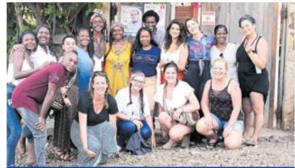
Las poblaciones que luchan con la pobreza también pueden reorganizarse y las más prosperar.